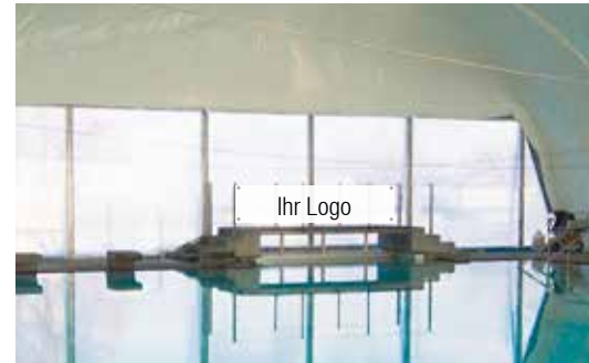
Logo-Präsenz in der Halle

Plus einmalige Kosten für Herstellung Werbebanner