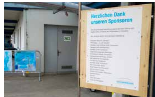
Namens-Präsenz am Eingang

Ihr Beitrag: Fr. 2'000 pro Saison, Laufzeit: 3–5 Jahre