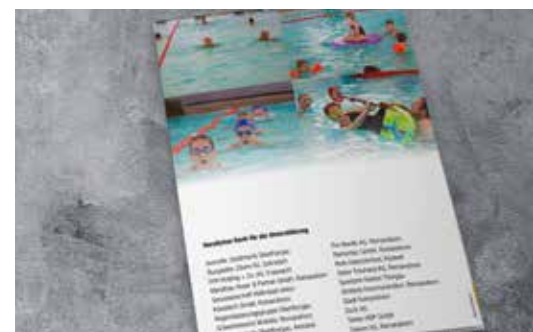
Namens-Präsenz in GV-Broschüre

Ihr Beitrag: Fr. 500 pro Saison, jährlich kündbar